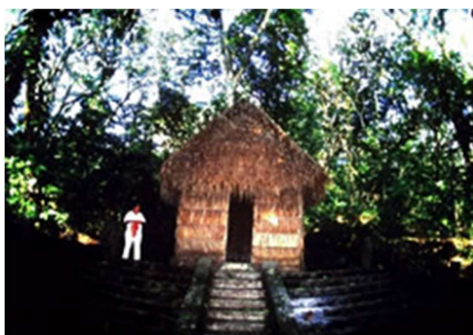
El chamán te espera