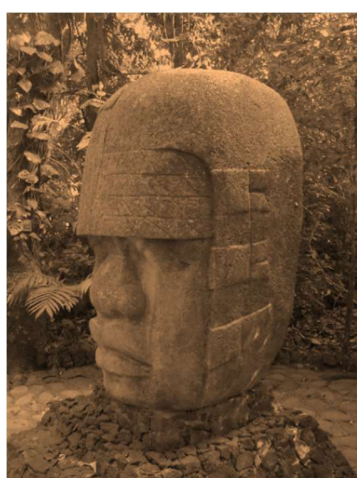
Majestuosa cabeza colosal

Cultura Olmeca, “la madre de las culturas de Mesoamérica” a conocer la más grande en Nanciyaga.