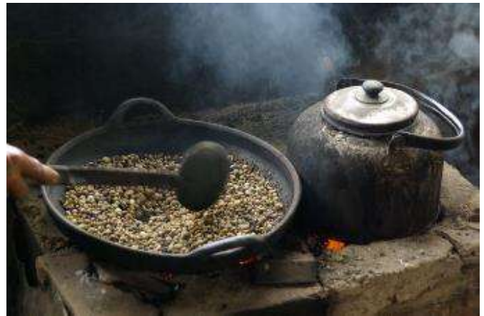
preparación tradicional de café tostado