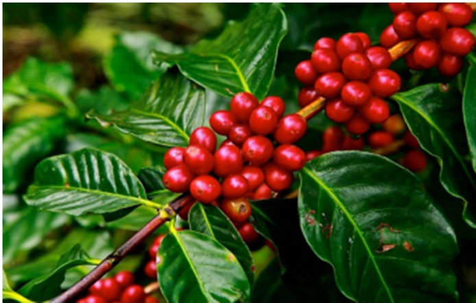
el Oro de los Tuxtlas