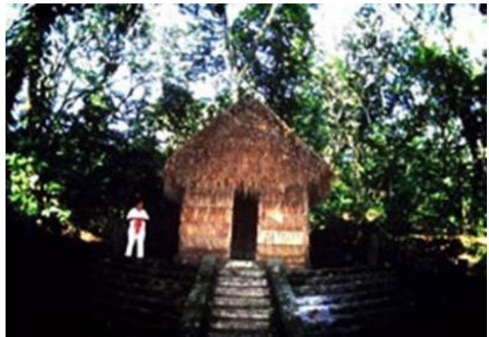
Hütte des Schamanen